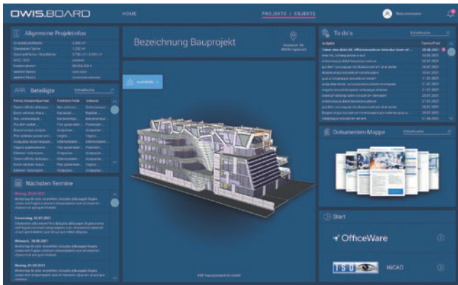
Dashboard als besondere Neuerung